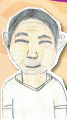
読書の秋で賞 大分市 たあた大好きさん (小5)